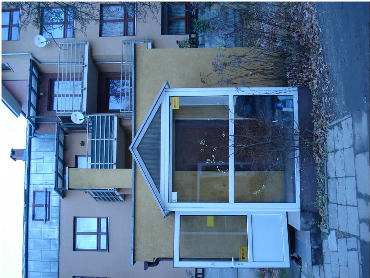
Wejścia do magazynu odzieży FOT.33