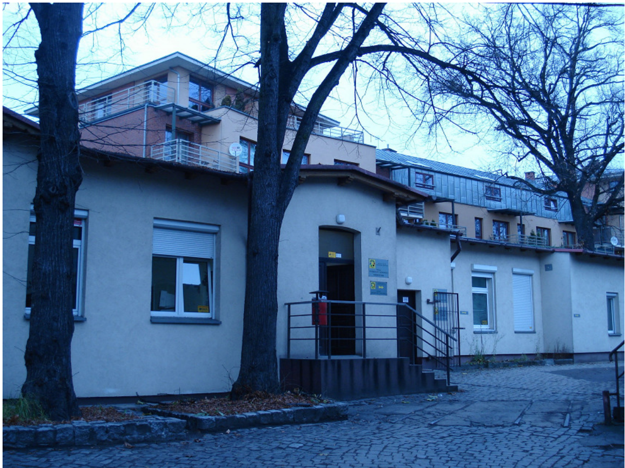
Wejście główne FOT.3