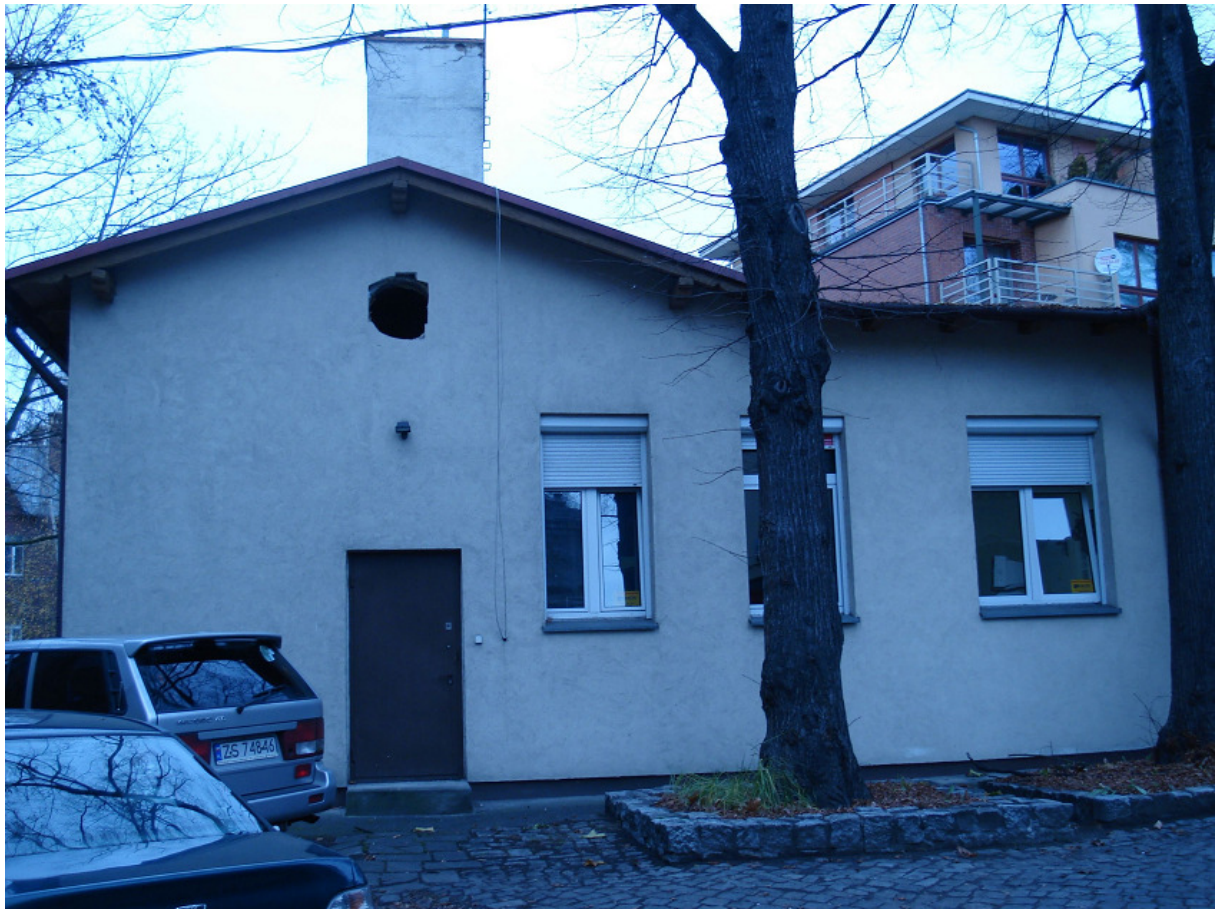
Ściana pld.-wsch. – wejście do piwnicy FOT.2