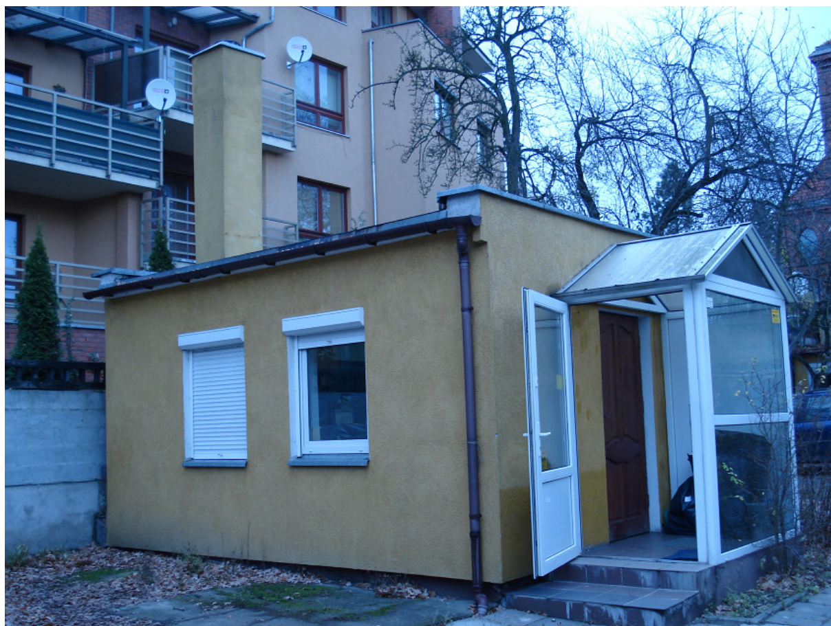
Budynek przeznaczony na magazyn odzieży FOT.32