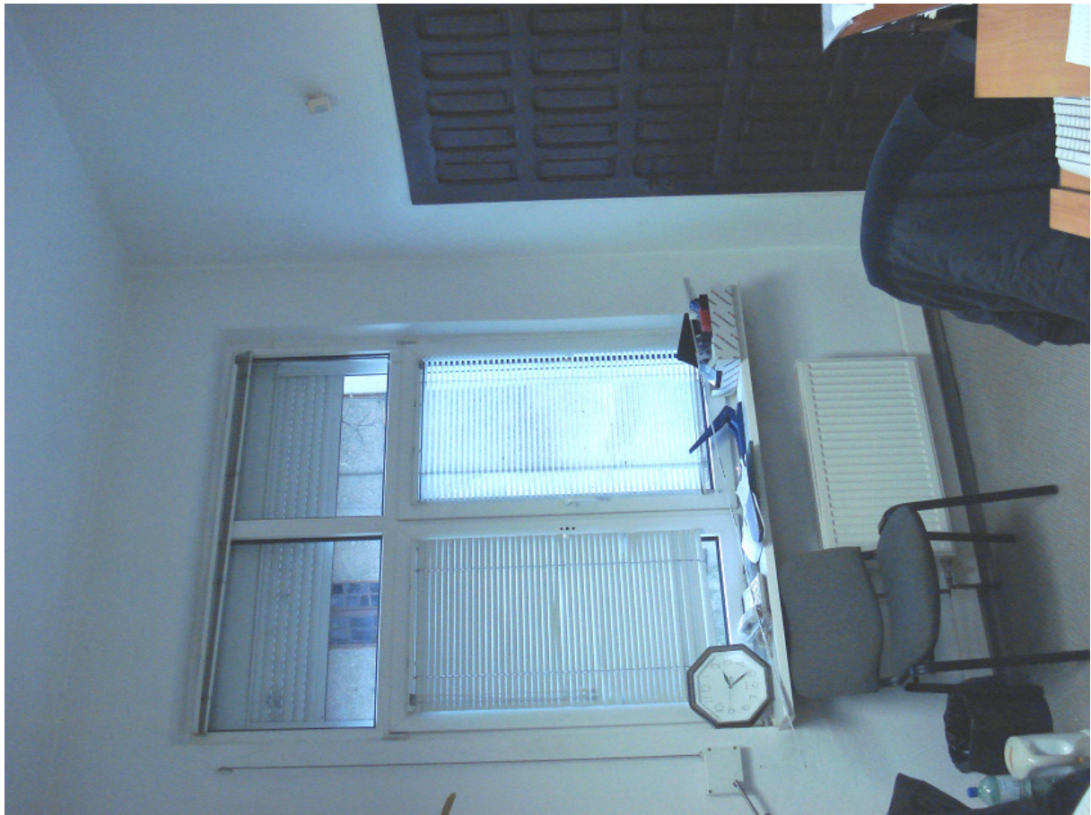
Pomieszczenie proj. biura FOT.18