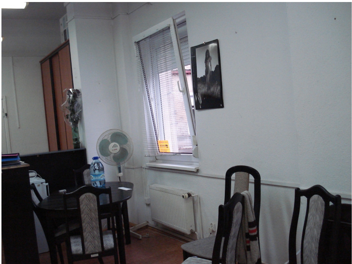
Pomieszczenie proj. szatni męskiej - pilastry FOT.30