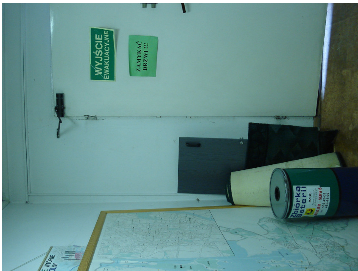
Wejście do przybudówki – przeznaczonej do rozbiórki FOT.31