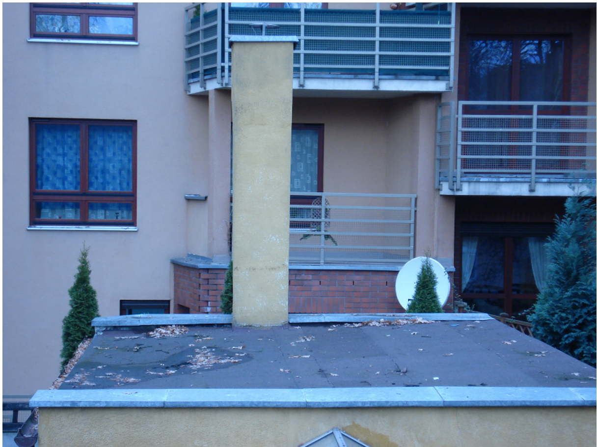
Dach magazynu odzieży FOT.35