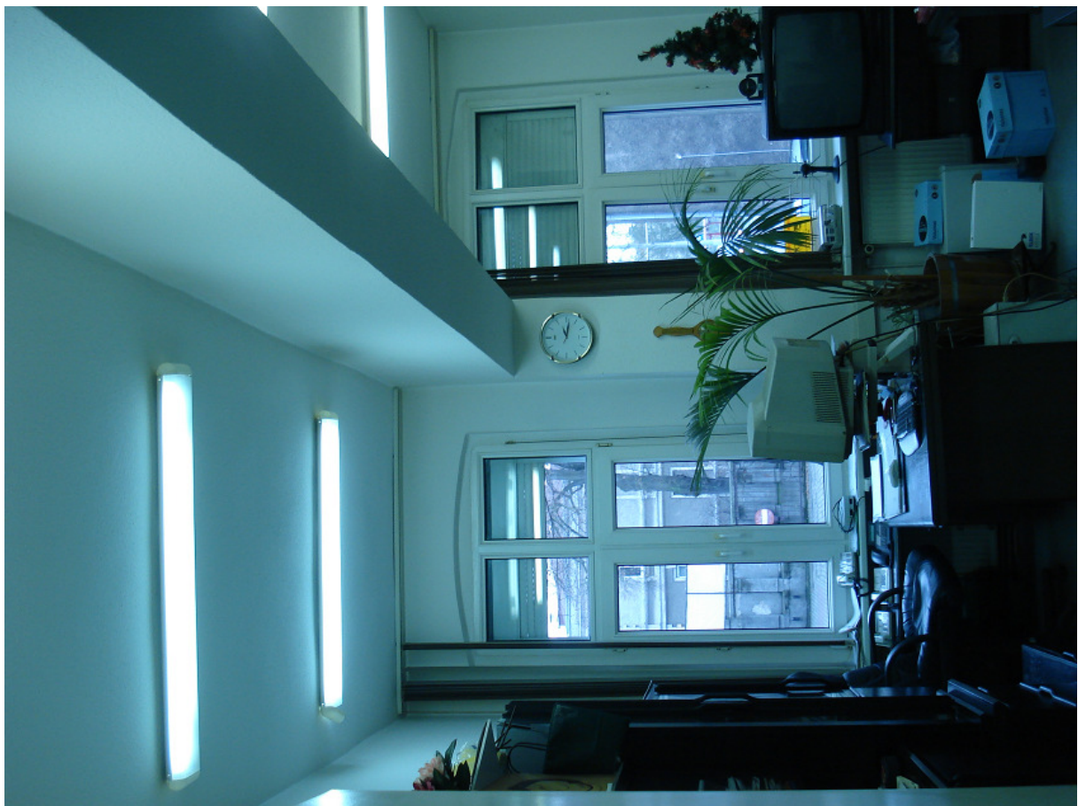
Podciąg pod d. ścianą zewnętrzną cz. wysokiej FOT.16