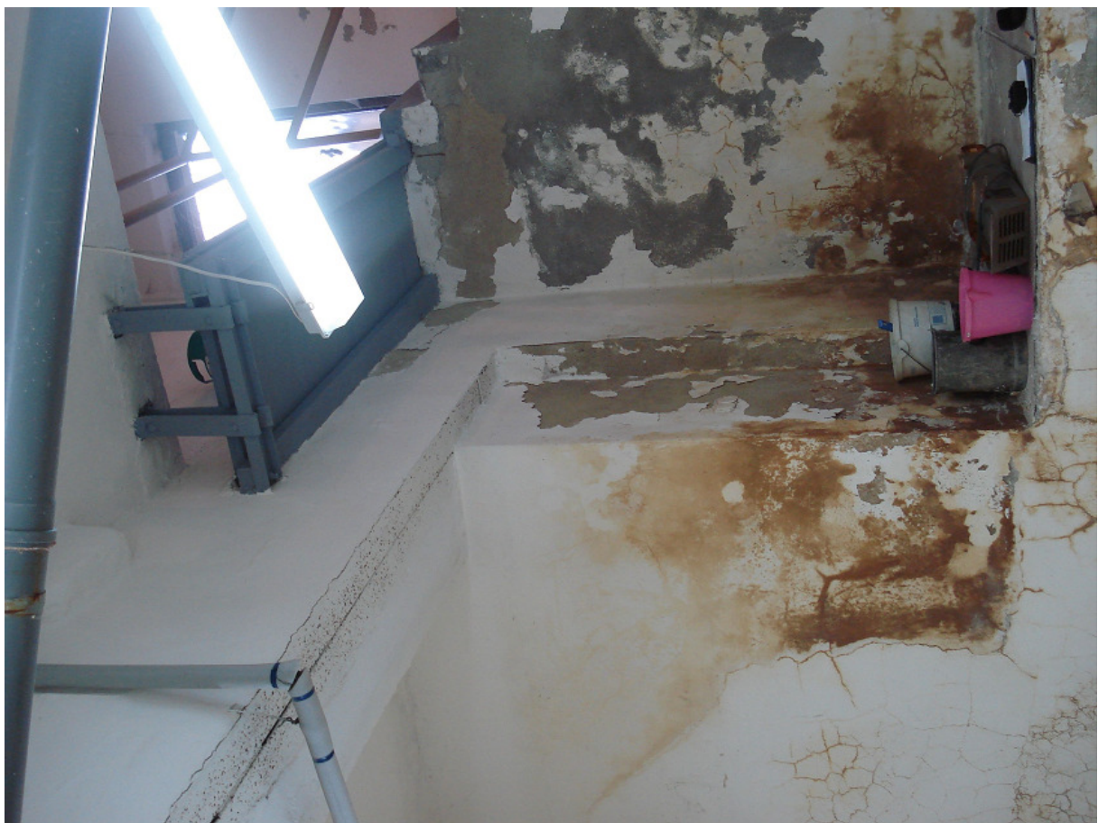
Pomost drewniany i zabudowa do rozbiórki FOT.10