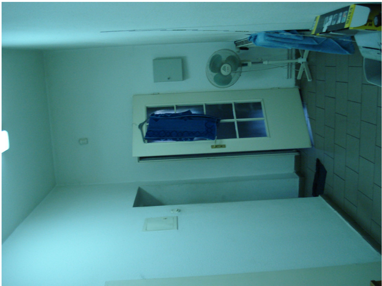
Korytarz główny w kierunku pom. z piecem c.o. FOT.20