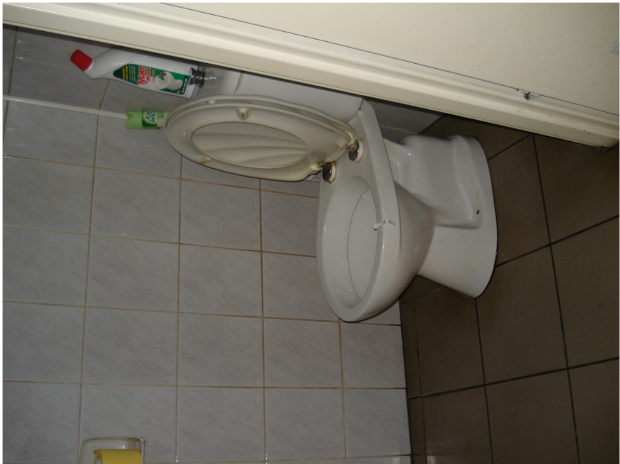
Sanitariat w/m natrysków damskich FOT.13