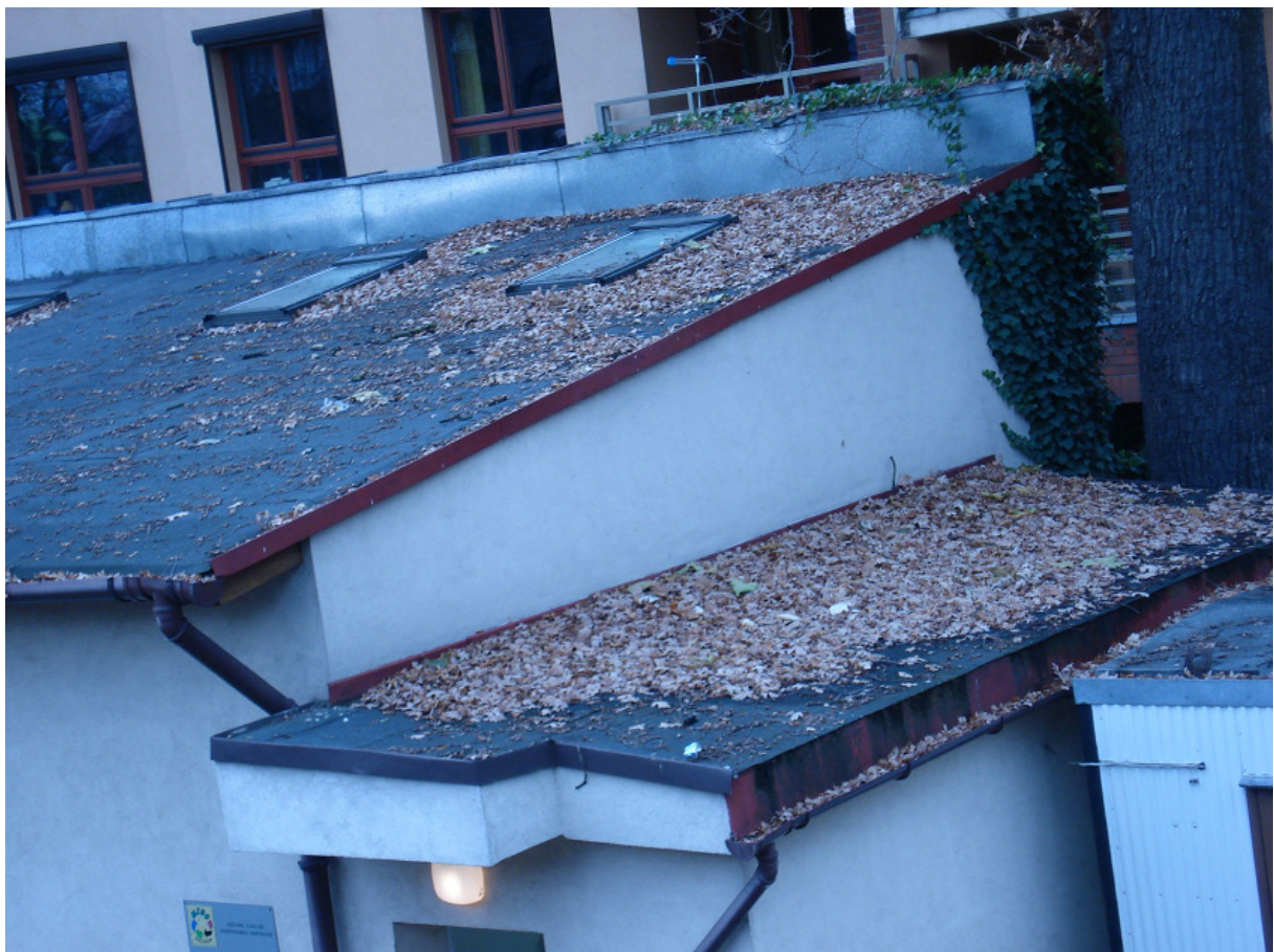
Okna połaciowe do rozbiórki, attyka FOT.8