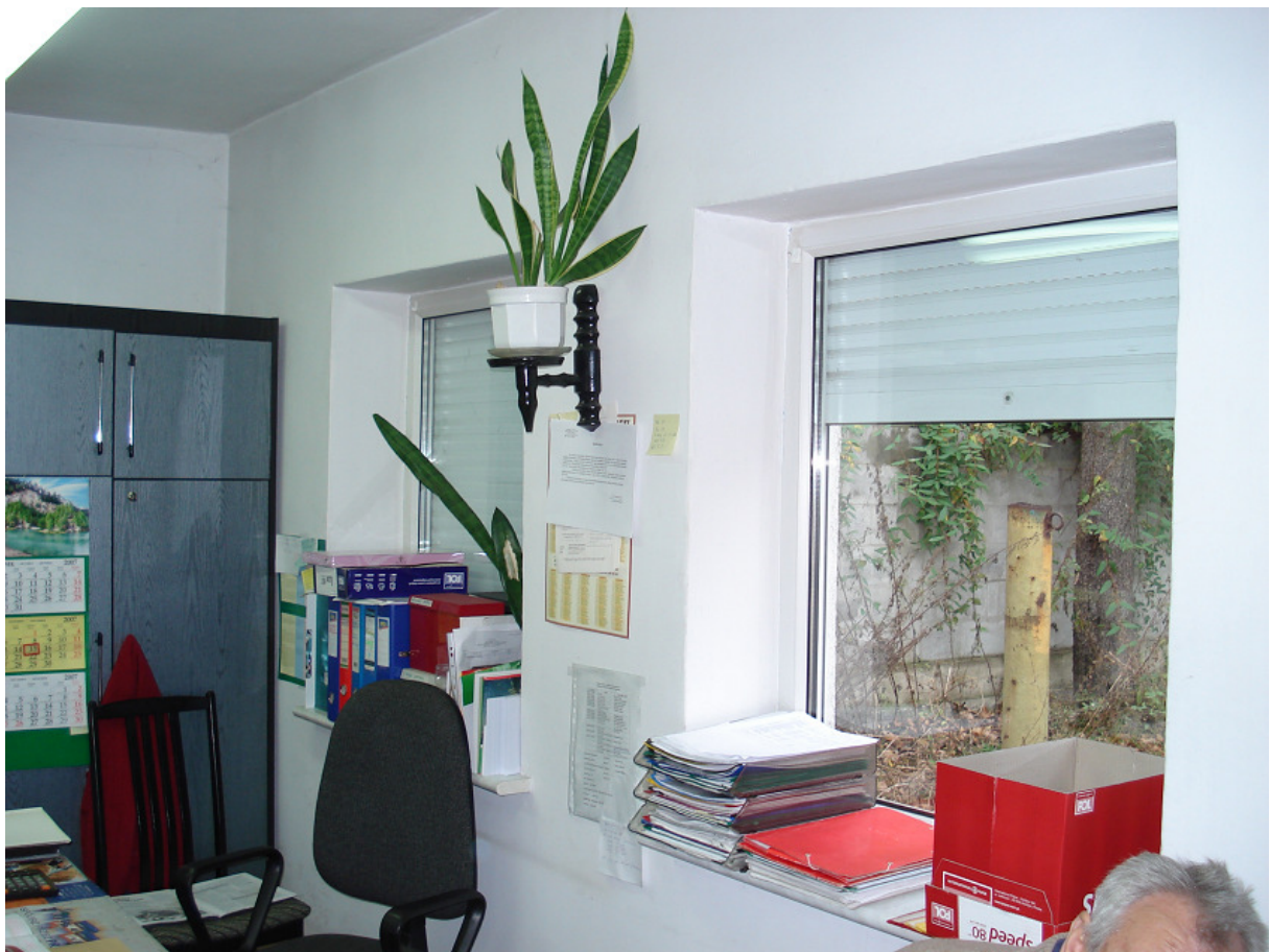
Wnętrze magazynu odzieży FOT.36