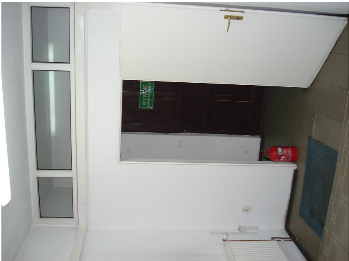
Pomieszczenie kasy – proj. pom. socjalne FOT.24