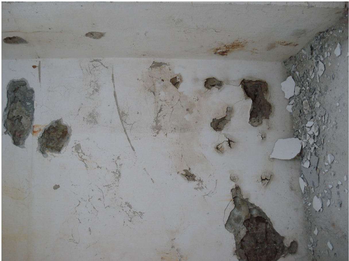
Zawilgocenie narożnika pn.- zach. – piwnica FOT.11