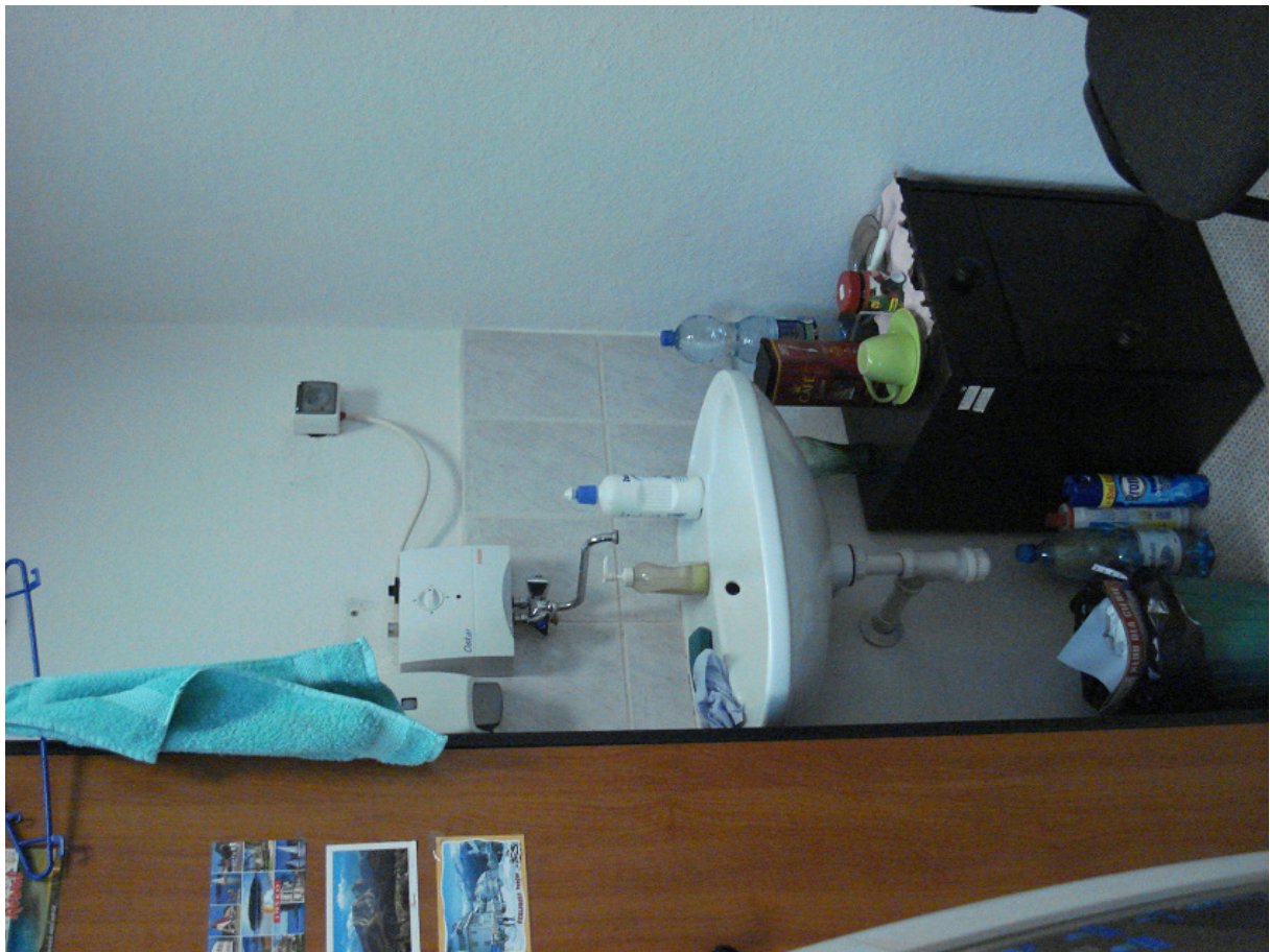
Kącik sanitarny w pom. z fot. 18 FOT.19