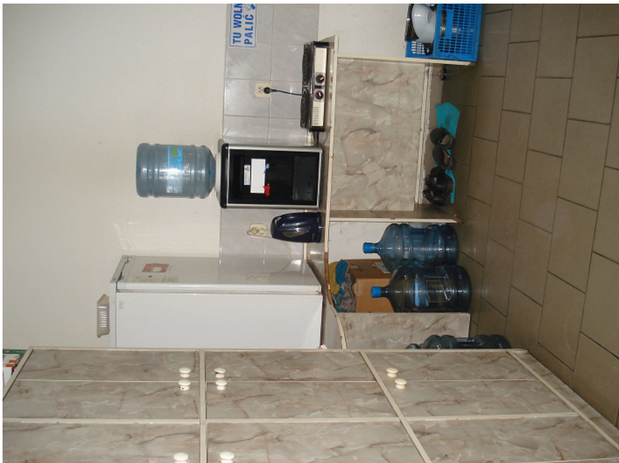
Pomieszczenie przy ścianie szczytowej zachodniej FOT.12