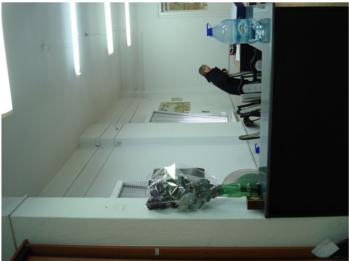
Pomieszczenie proj. szatni męskiej