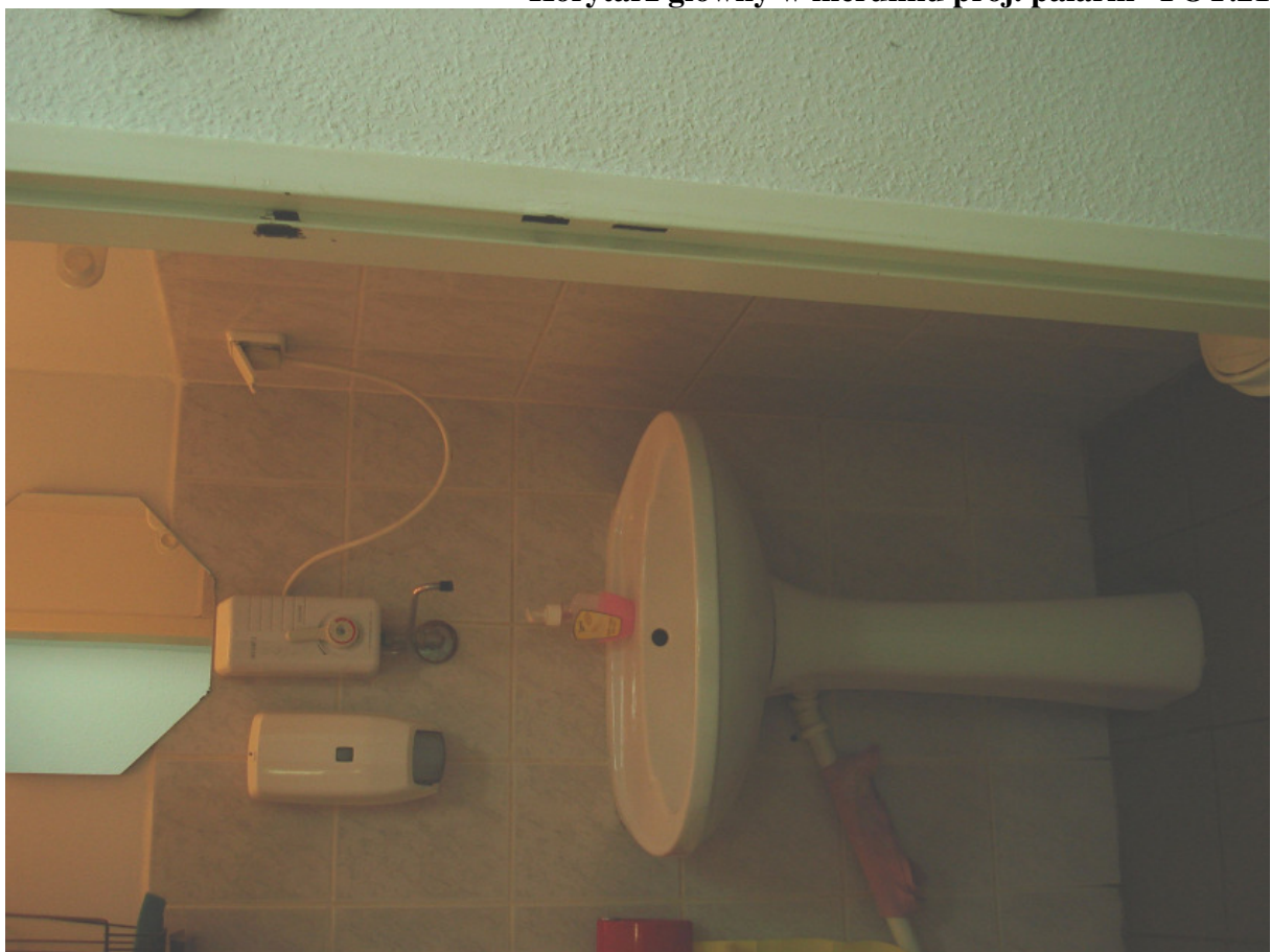
WC przy proj. palarni FOT. 22