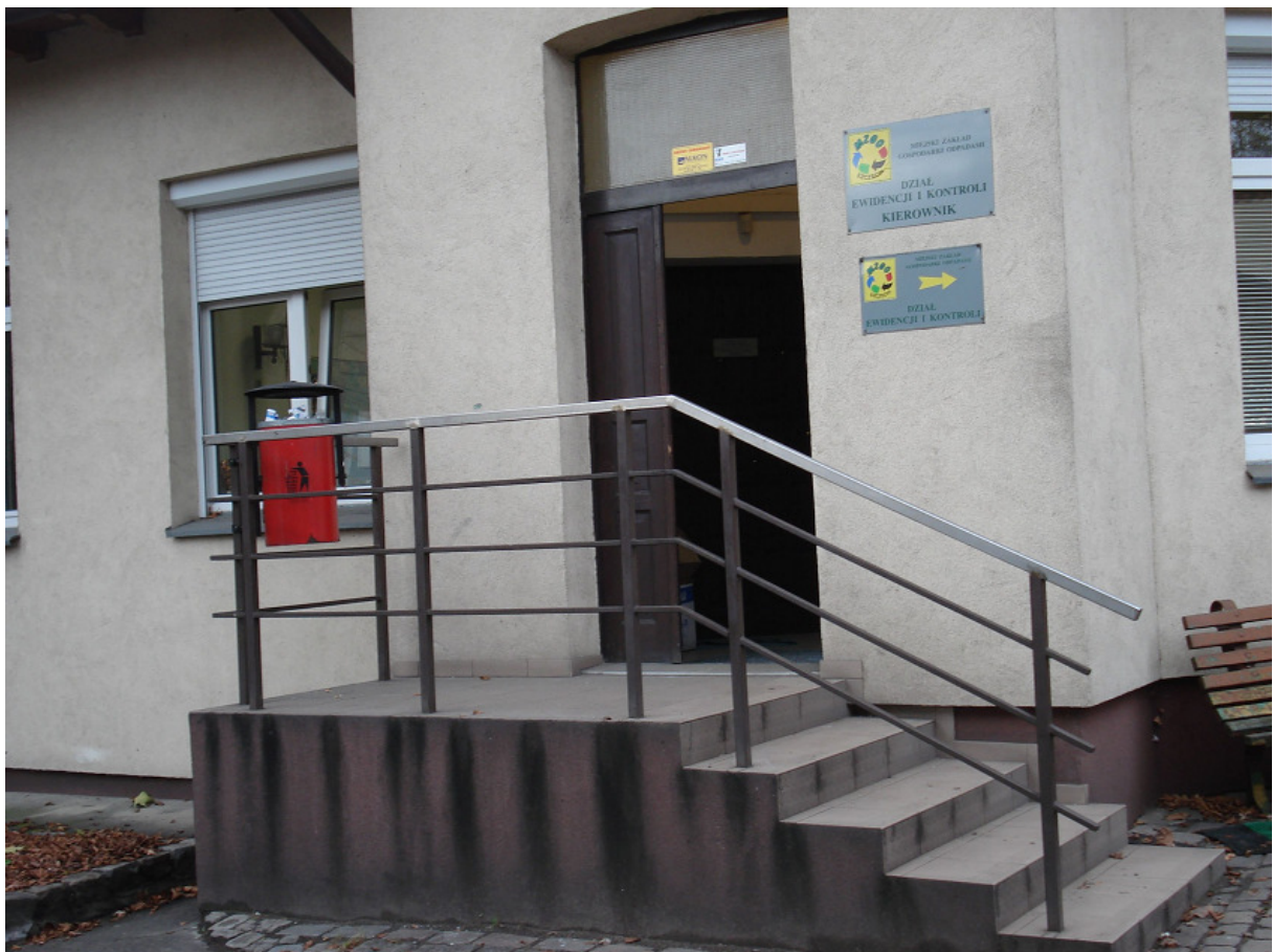
Schody wejścia głównego FOT.4