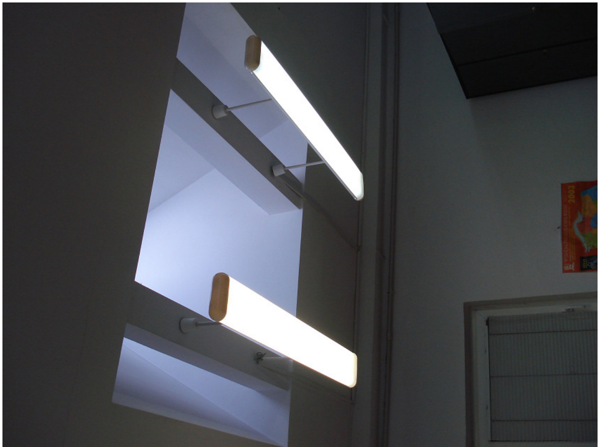
Okna połaciowe w proj. szatni męskiej FOT.29