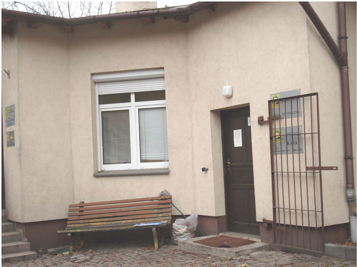
Wejście do proj. palarni FOT.5