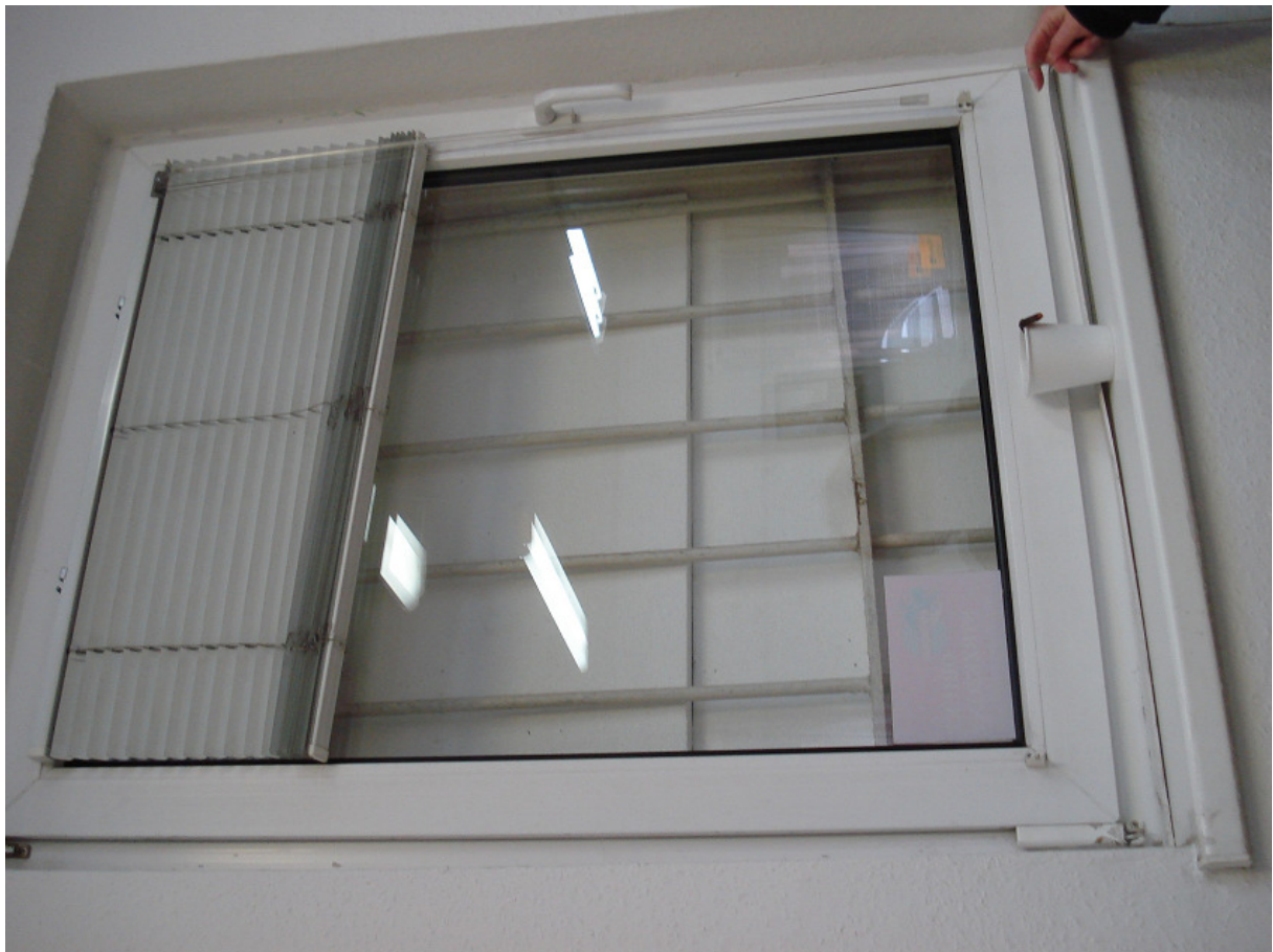
Okna do замуrowania w ścianie podłużnej FOT.27