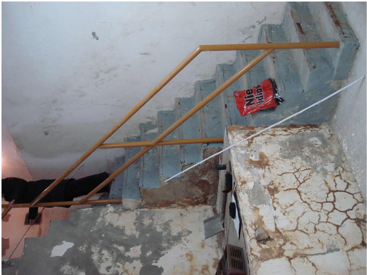
Zejsście do piwnicy FOT.9