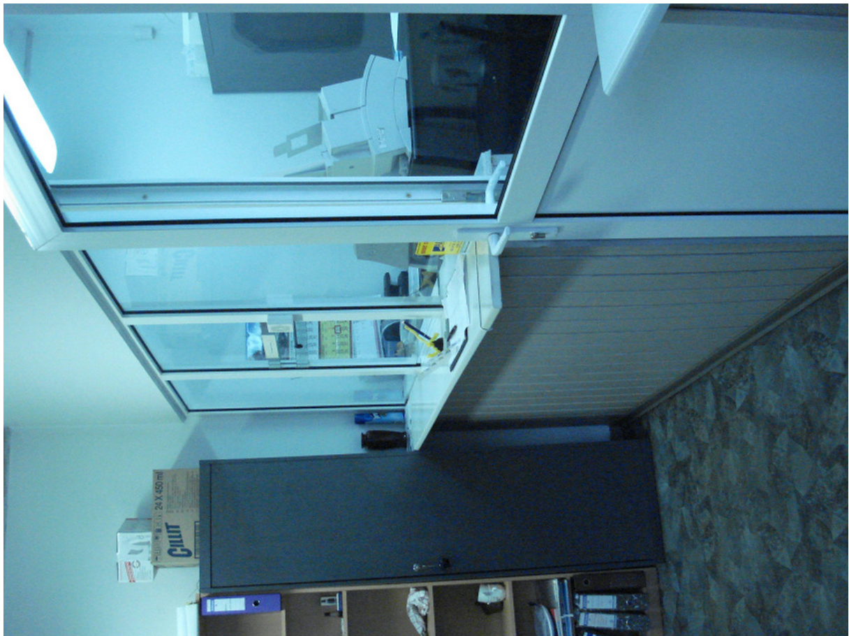
Pomieszczenie kasy – proj. pom. socjalne FOT.25