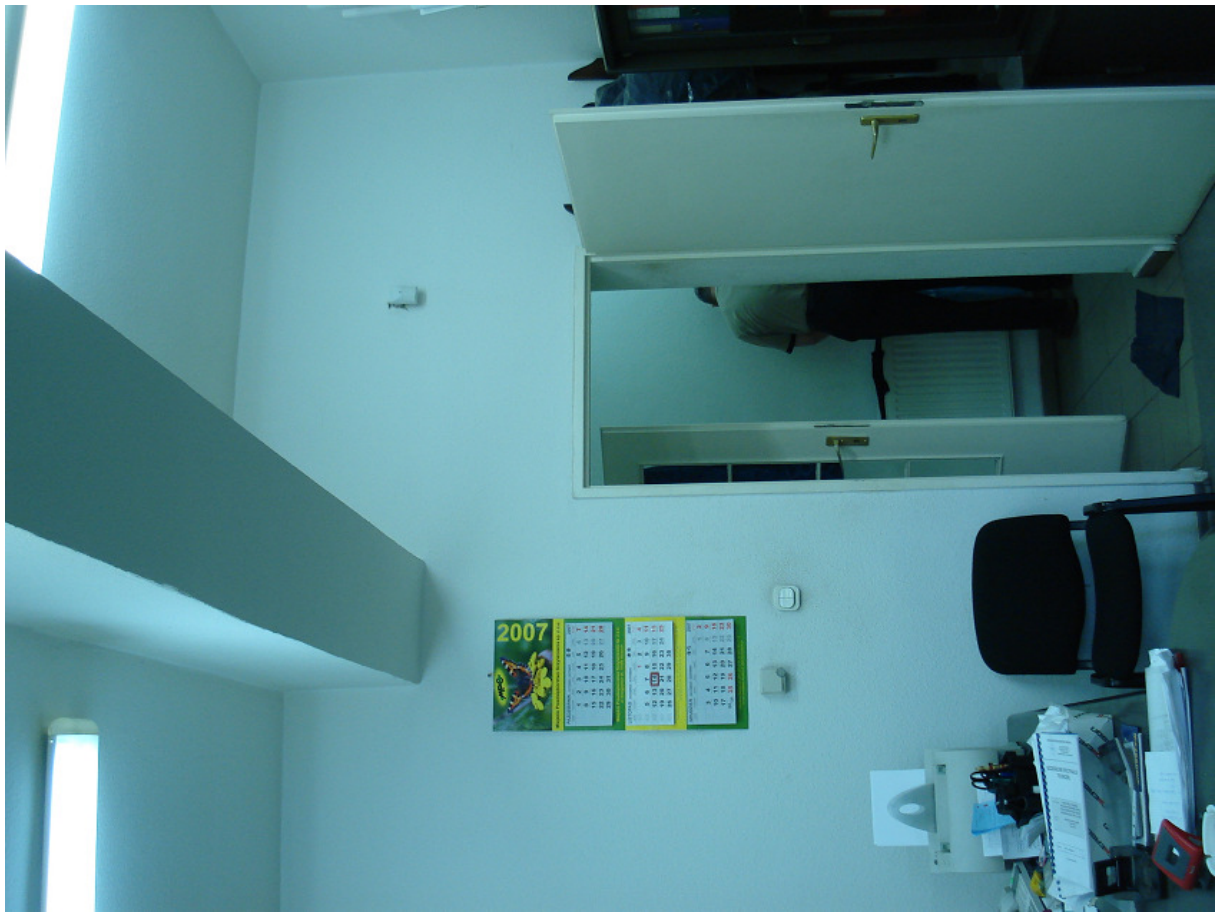
Podciąg pod ścianą cz. wysokiej FOT.17