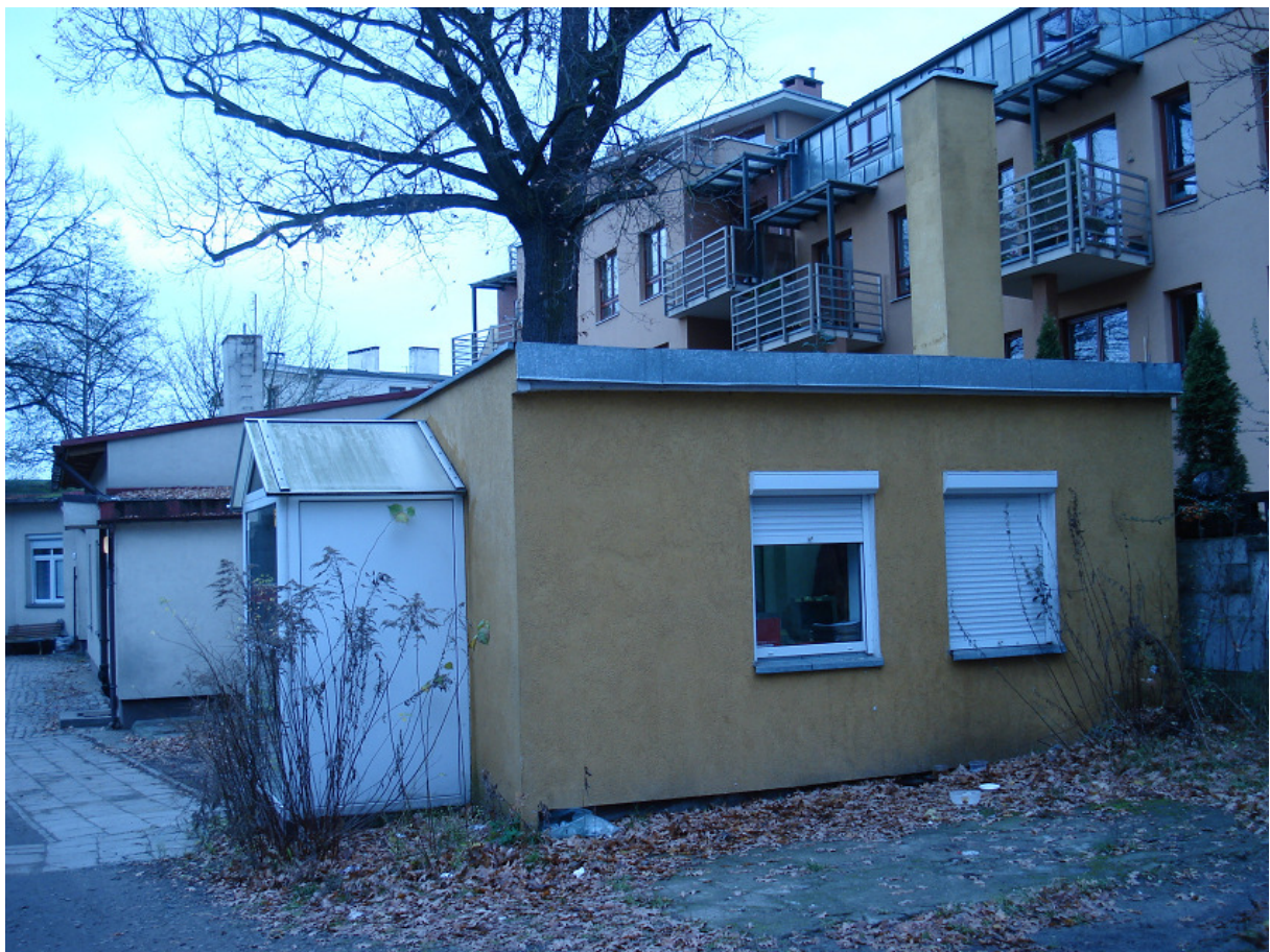
Magazyn odzieży FOT.34