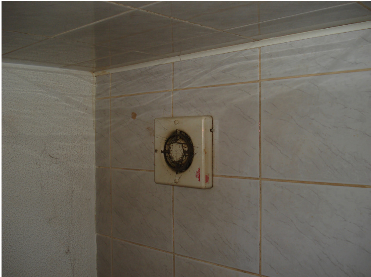
Wentylacja sanitariatu FOT.14