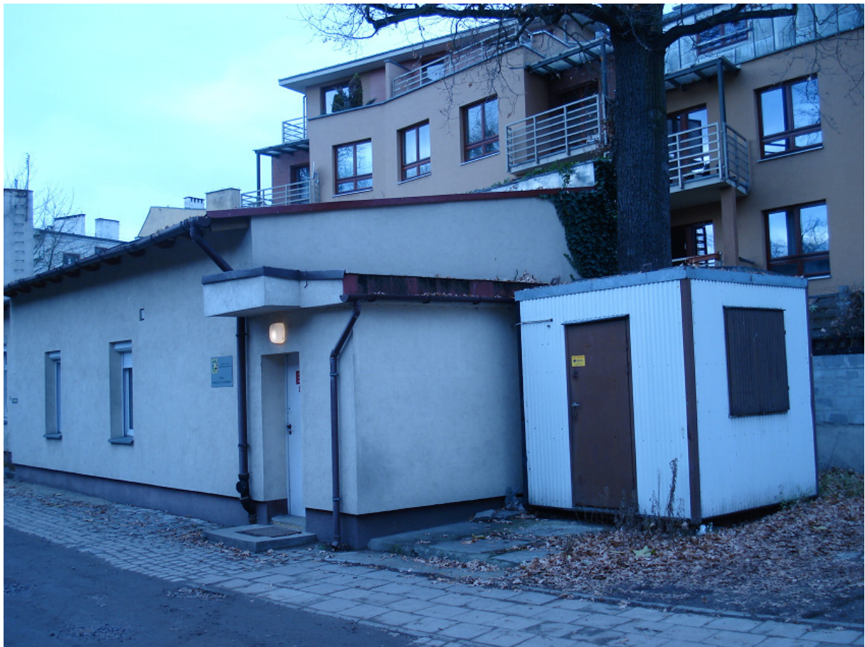
Dachy i przybudówka do rozbiórki FOT.7