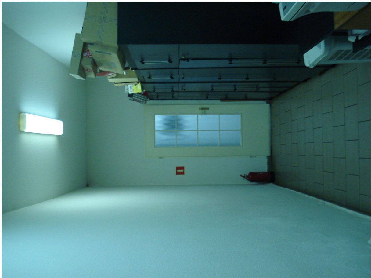
Korytarz główny w kierunku proj. palarni FOT.21