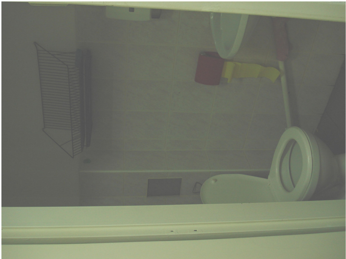
WC przy proj. palarni FOT.23