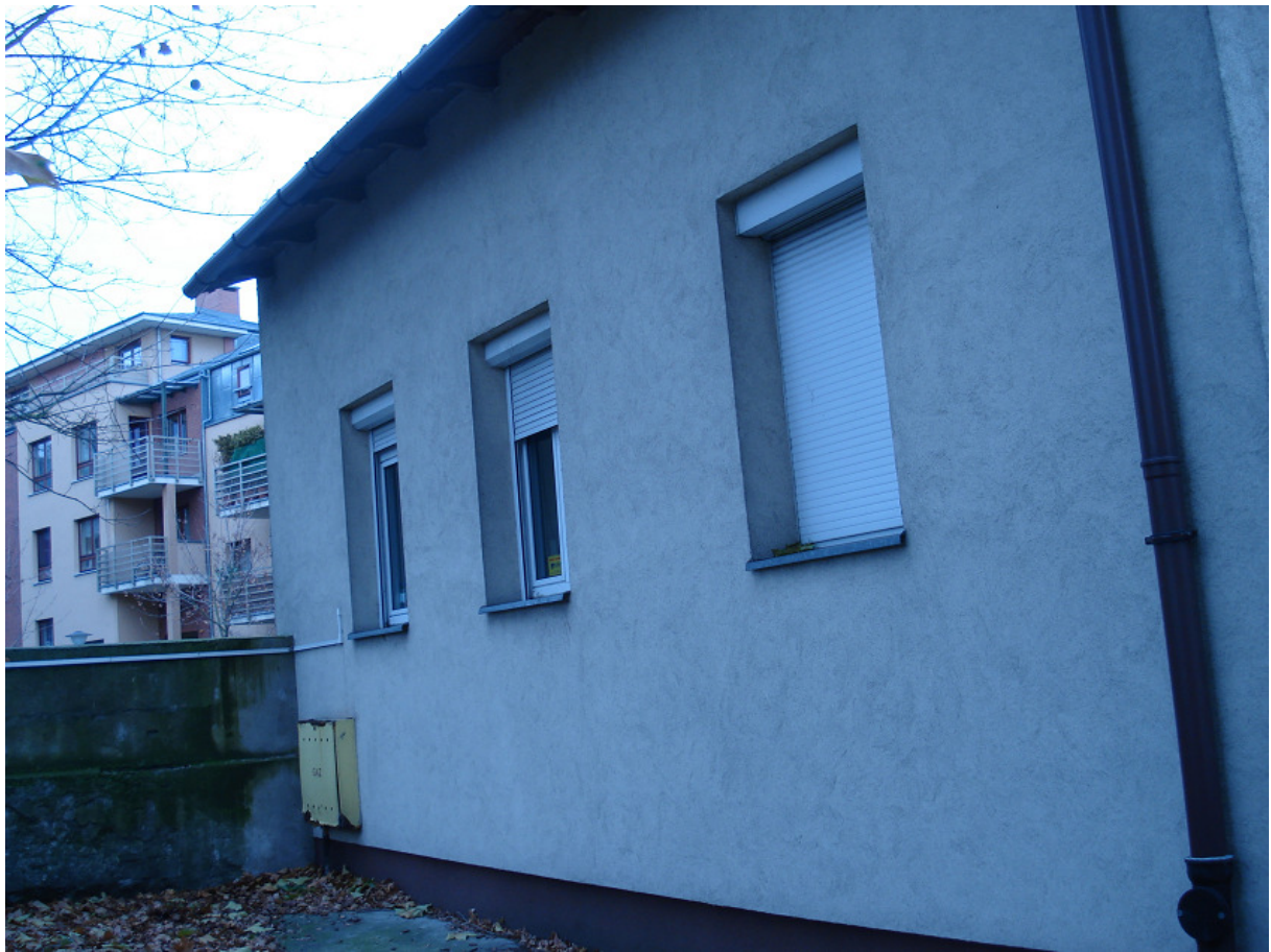
Ściana szczytowa pld.- zach. FOT.1